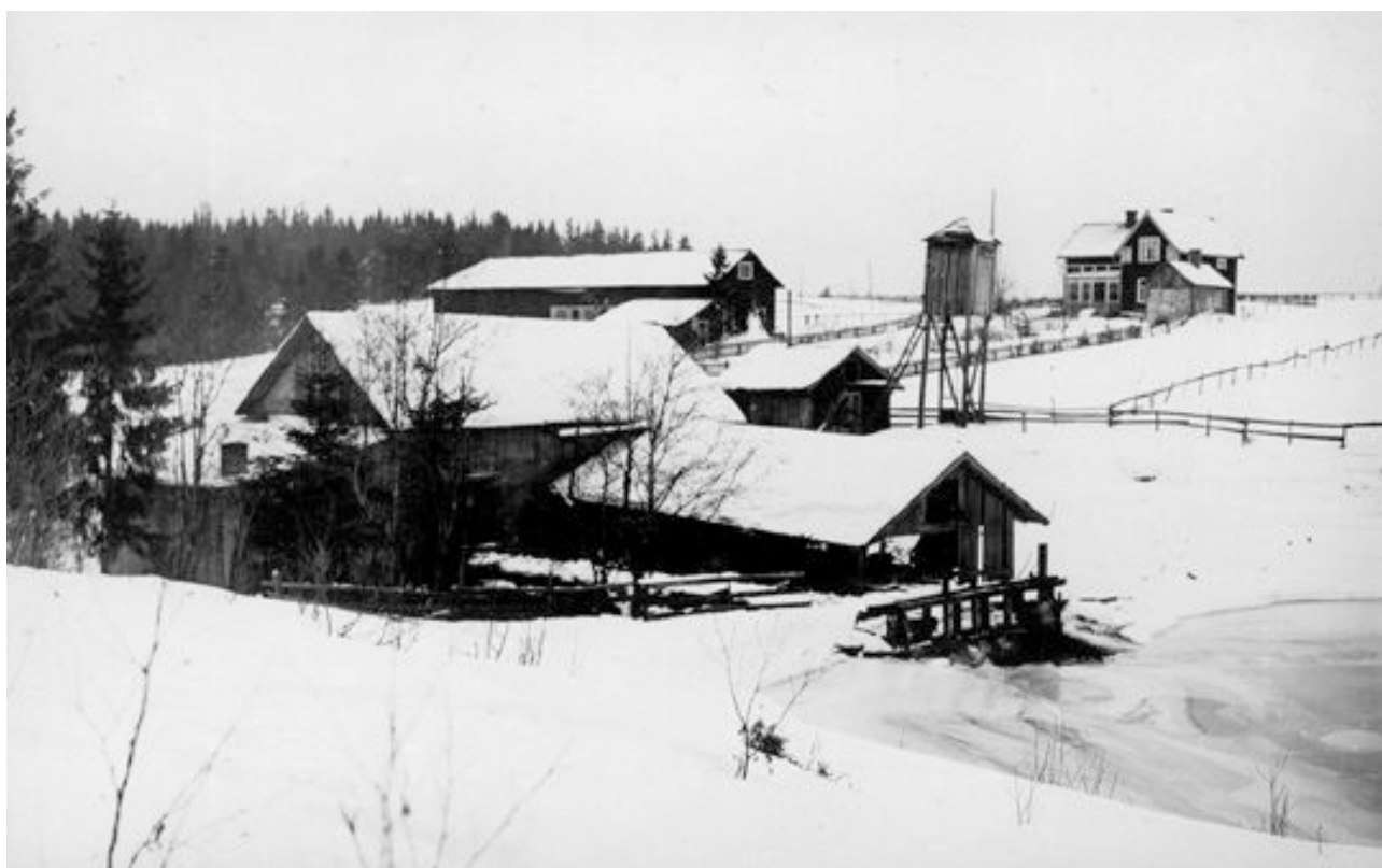
Myrsågen på 1930-talet