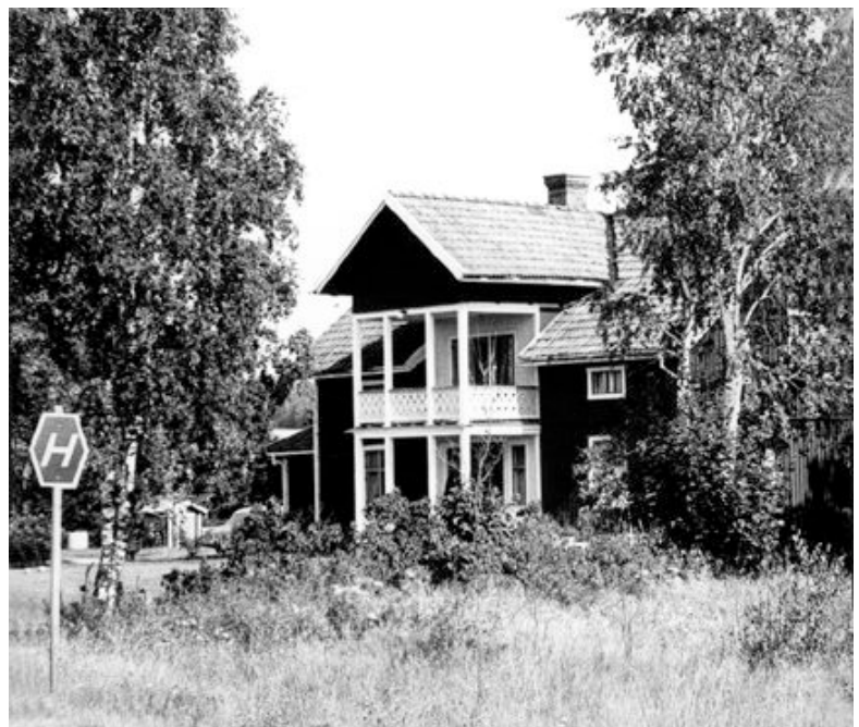
Lundegård, 1967 Obs påminnelseskylden för högertrafik