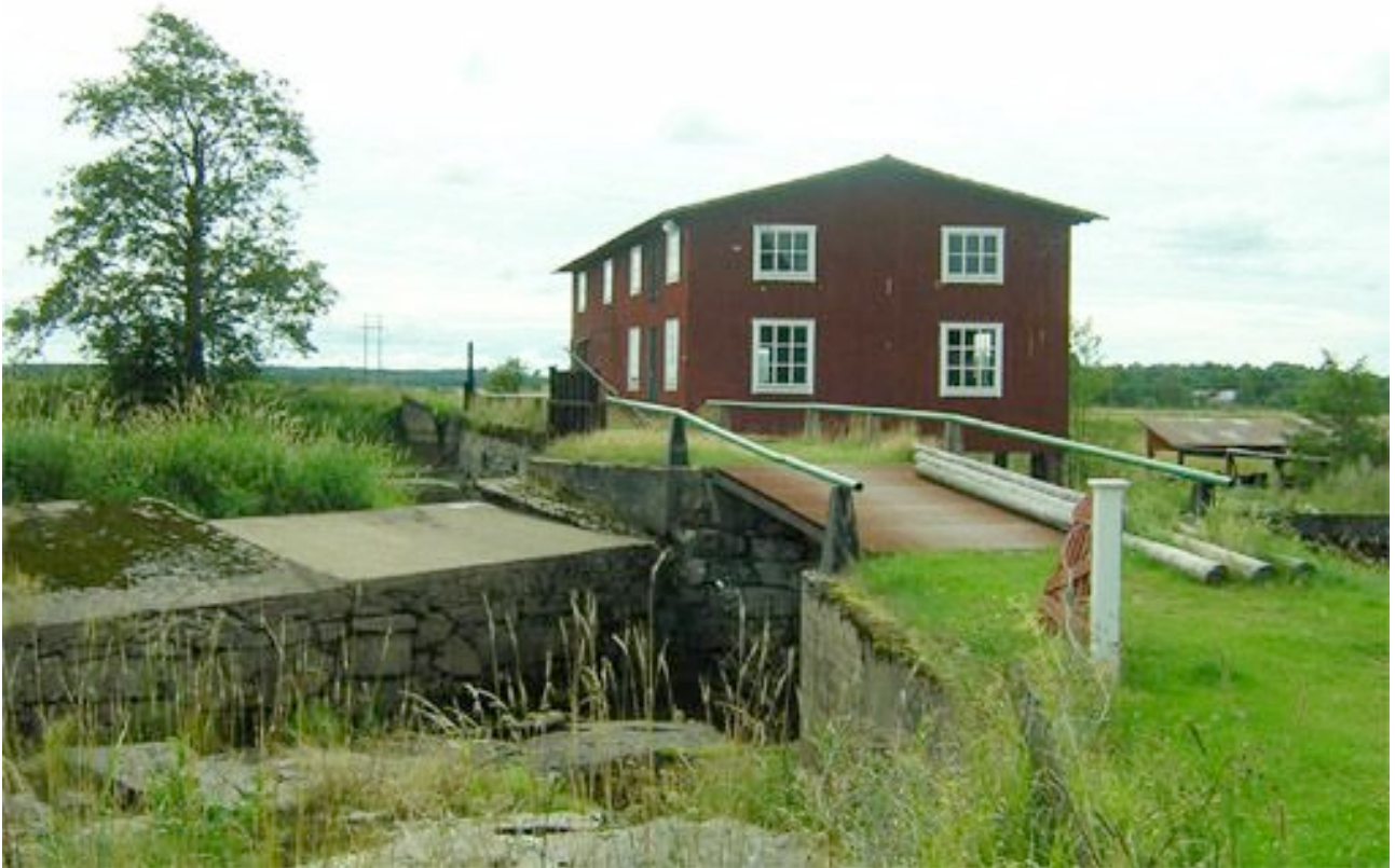
Ruds kvarn i Väse

Den 26/1 1894 5 flyttade han från V:a Ämtervik till Väse där han under åren 1894-1899 innehade Ruds Kvarn. Kvarnen ligger ganska nära Väse kyrka.