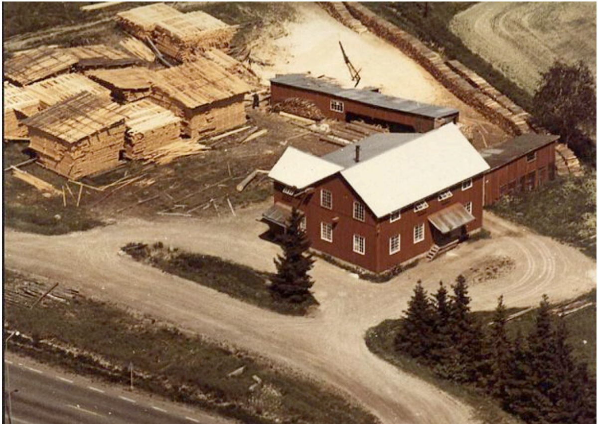
Fagerås Kvarn & Såg