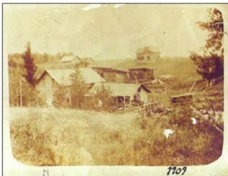
1909 är inte bostadshus och uthus färdigbyggda